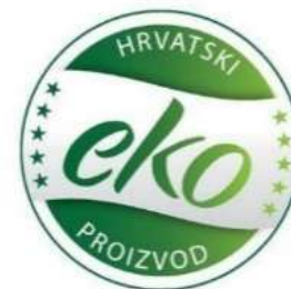
Neobvezni nacionalni znak eko-proizvoda