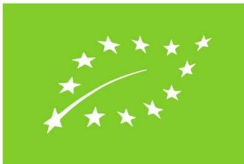
Obvezni EU znak eko-proizvoda

DEKLARACIJA “eko-proizvoda” mora sadržavati podatke koji su propisani odredbama hrvatskih propisa i propisa Europske unije navedenih u prvom koraku.